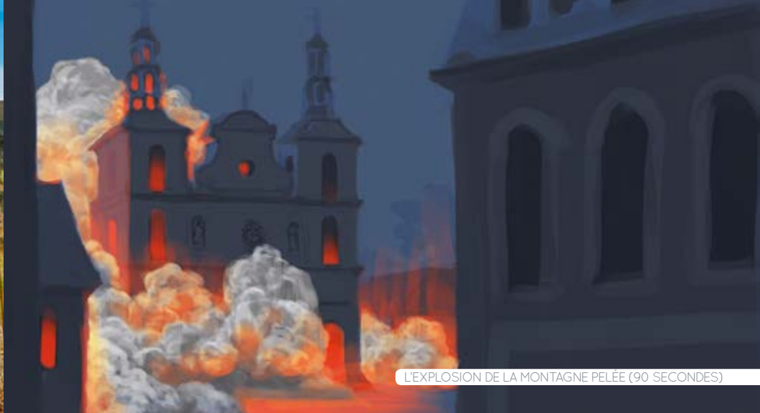
L'EXPLOSION DE LA MONTAGNE PELÉE (90 SECONDES)