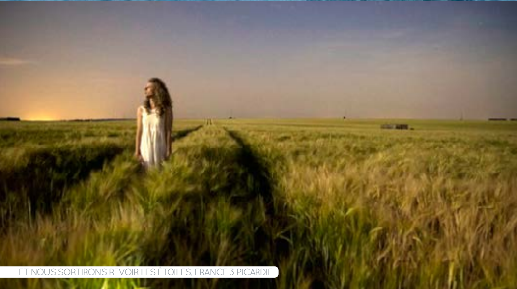
ET NOUS SORTIRONS REVOIR LES ÉTOILES, FRANCE 3 PICARDIE