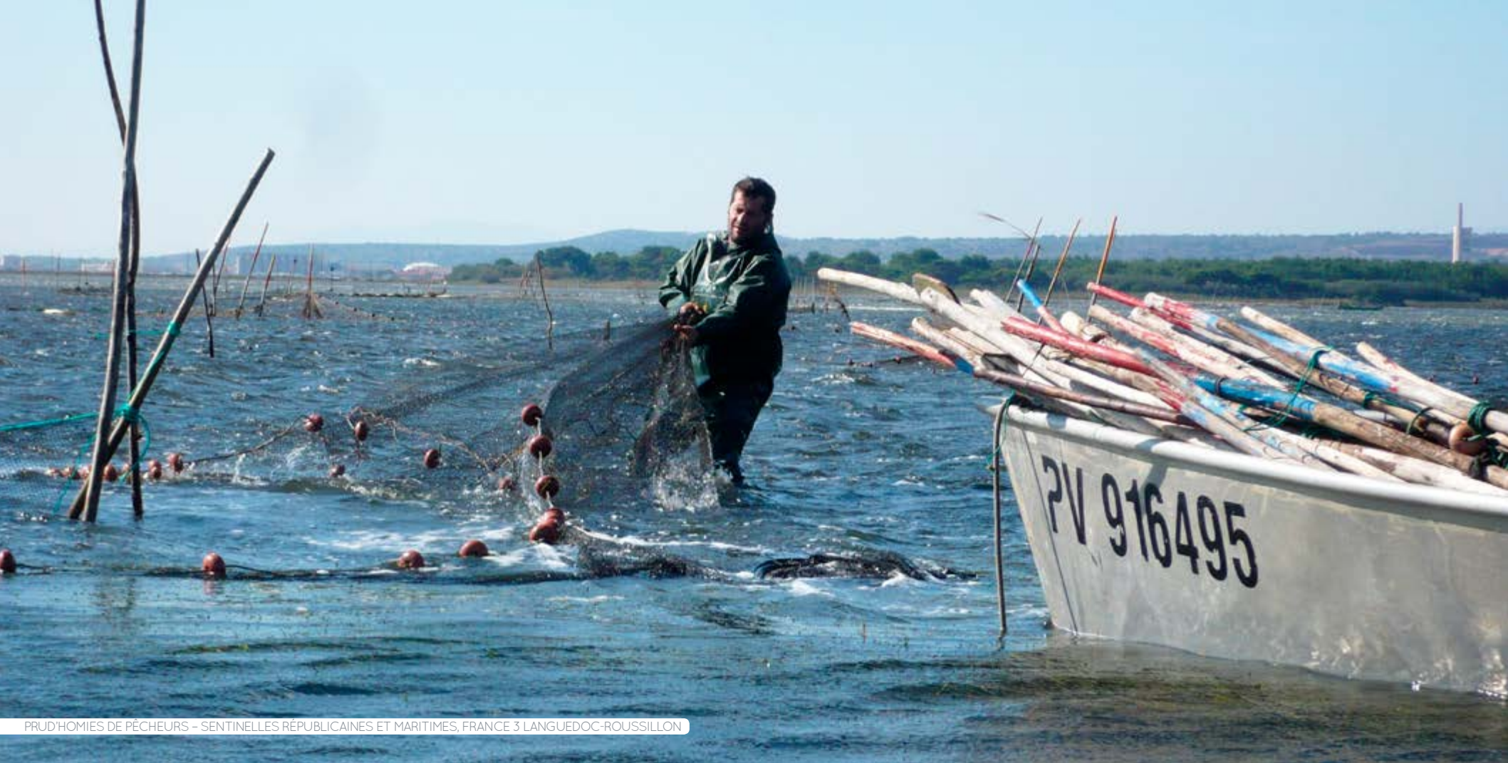
PRUD'HOMIES DE PÊCHEURS – SENTINELLES RÉPUBLICAINES ET MARITIMES, FRANCE 3 LANGUEDOC-ROUSSILLON