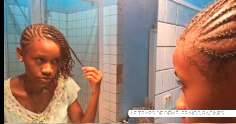
LE TEMPS DE DÉMÊLER NOS RACINES