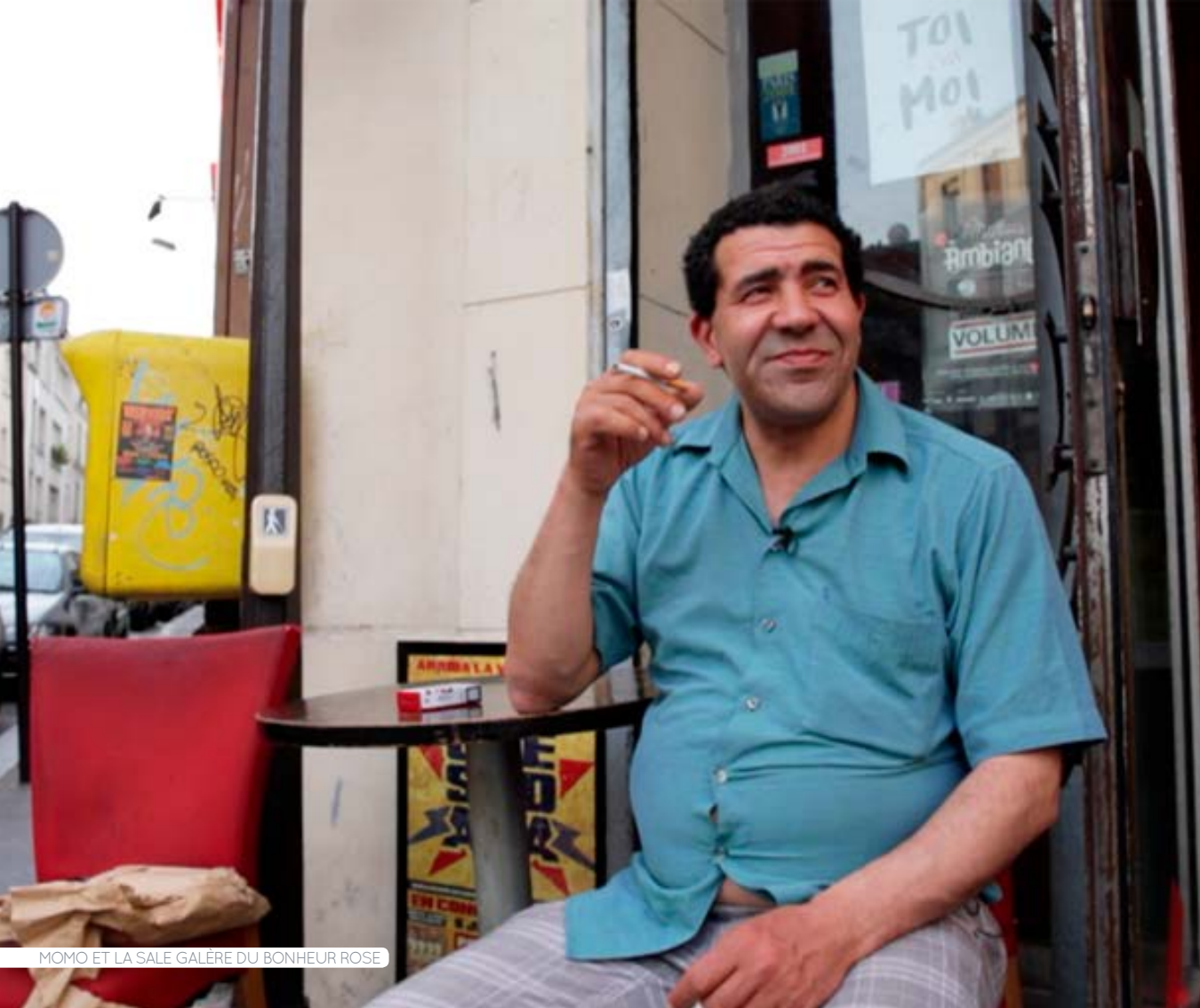
MOMO ET LA SALE GALÈRE DU BONHEUR ROSE