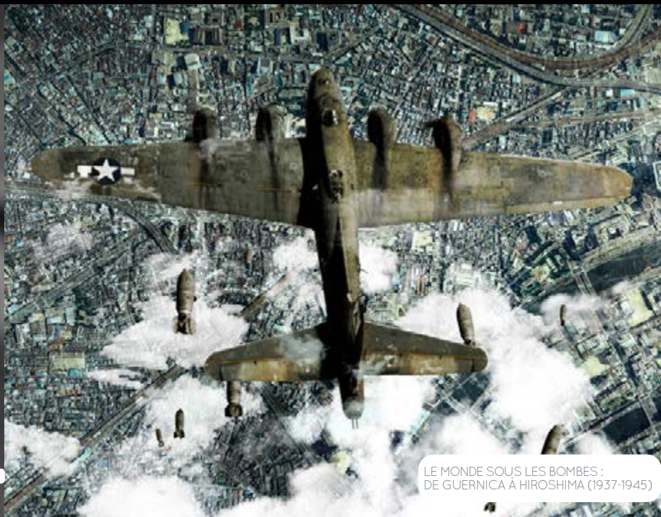
LE MONDE SOUS LES BOMBES : DE GUERNICA À HIROSHIMA (1937-1945)