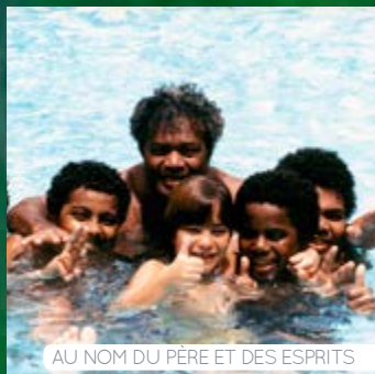
AU NOM DU PÈRE ET DES ESPRITS