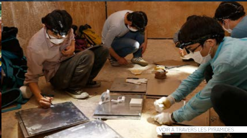
VOIR À TRAVERS LES PYRAMIDES