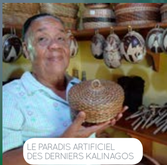
LE PARADIS ARTIFICIEL DES DERNIERS KALINAGOS

Directeur exécutif en charge de l'Outre-mer