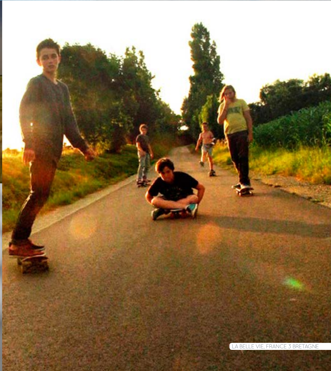
LA BELLE VIE, FRANCE 3 BRETAGNE