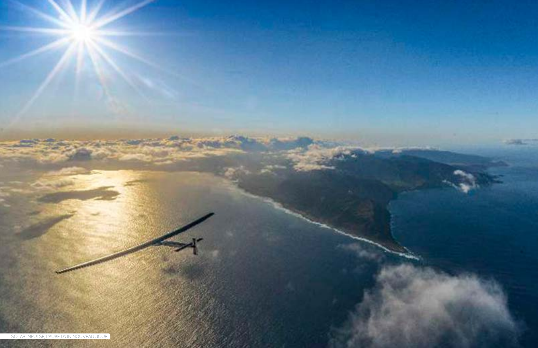
SOLAR IMPULSE, L'AUBE D'UN NOUVEAU JOUR