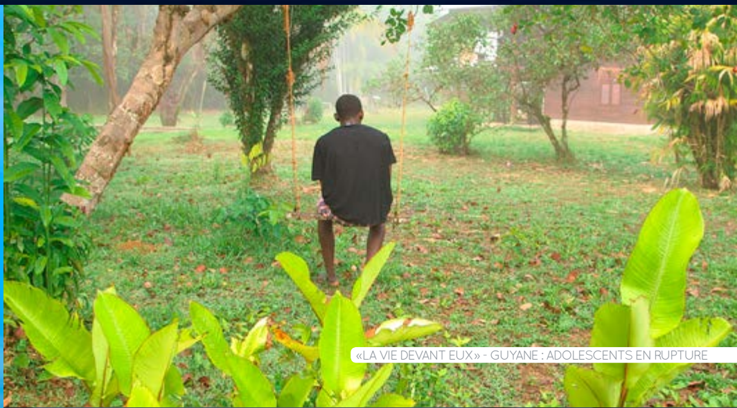
«LA VIE DEVANT EUX» - GUYANE : ADOLESCENTS EN RUPTURE