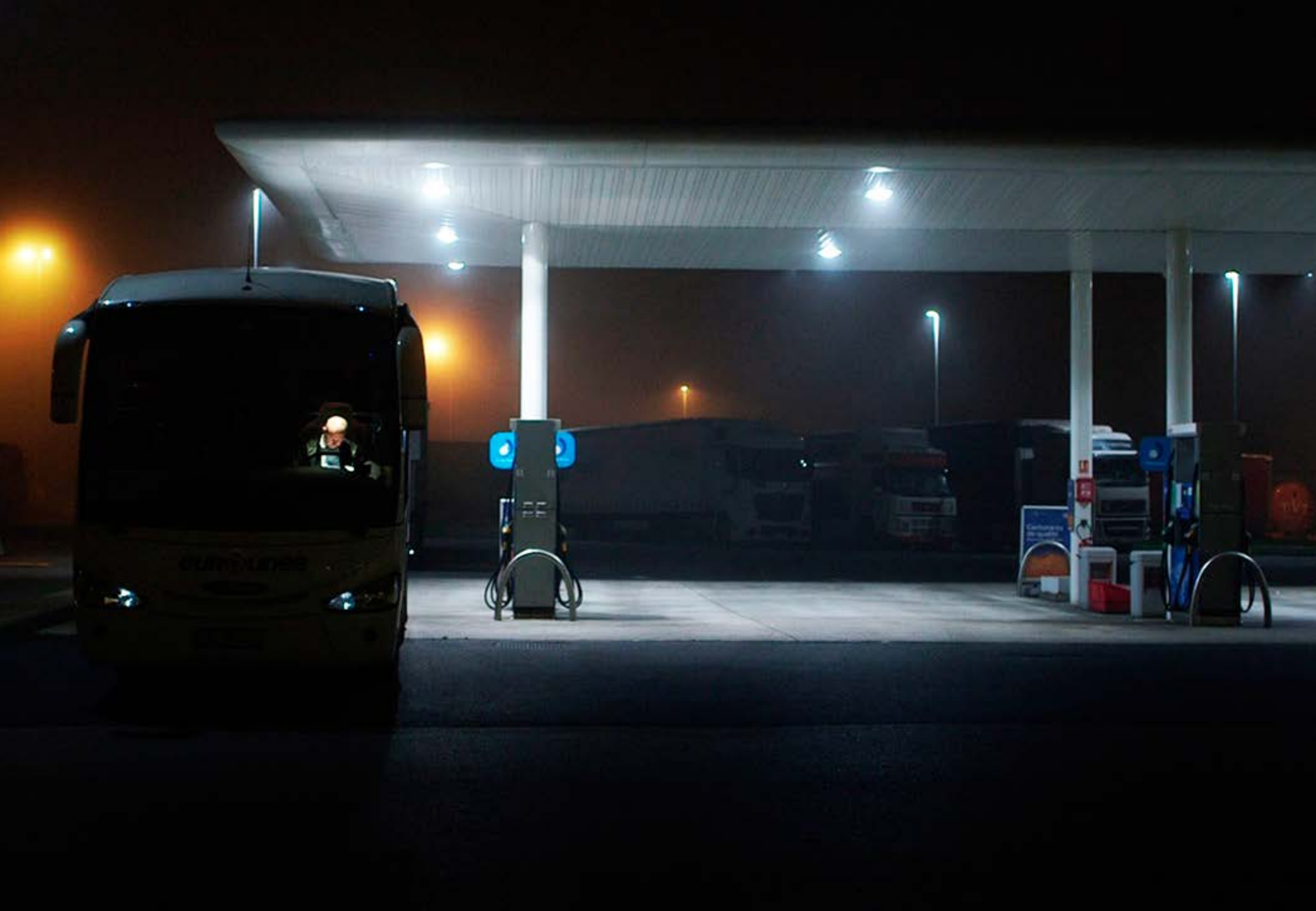
DES JOURS ET DES NUITS SUR L'AIRE