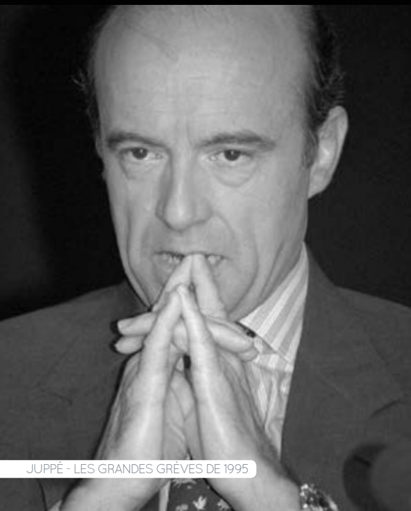
JUPPÉ - LES GRANDES GRÈVES DE 1995