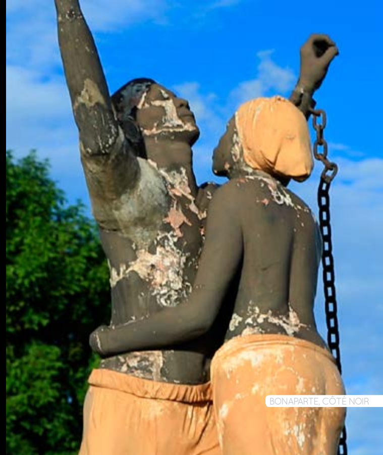
BONAPARTE, CÔTE NOIR