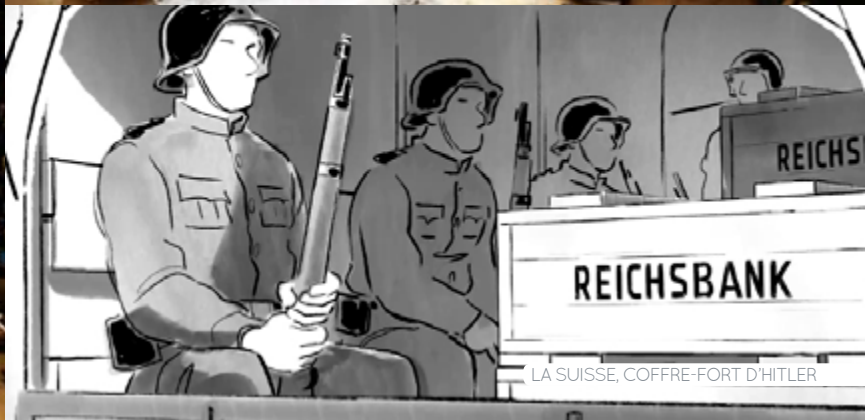
LA SUISSE, COFFRE-FORT D'HITLER