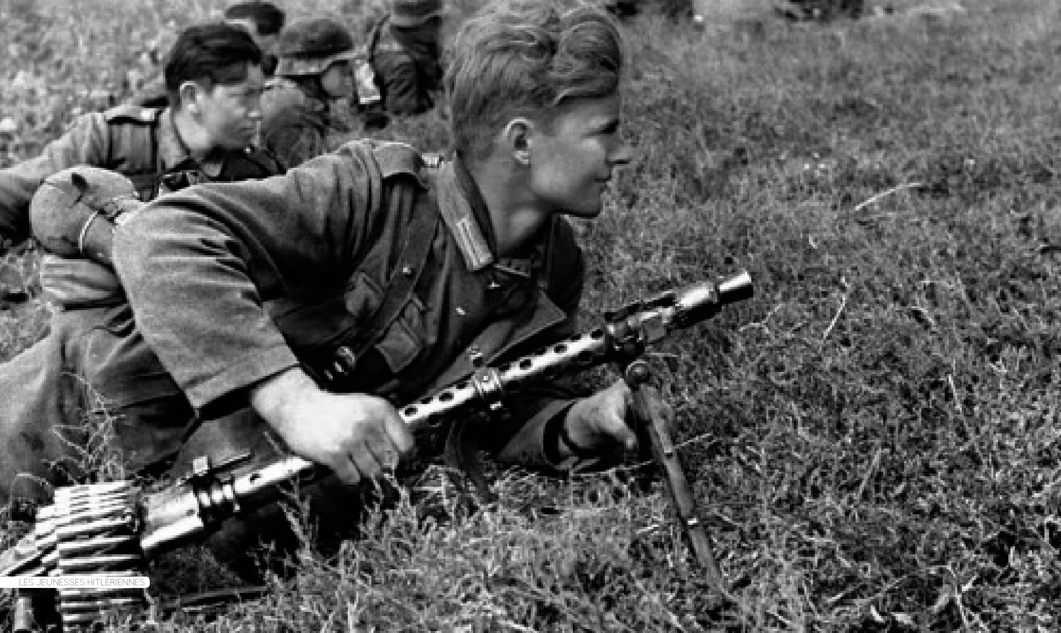
LES JEUNESSES HITLÉRIENNES