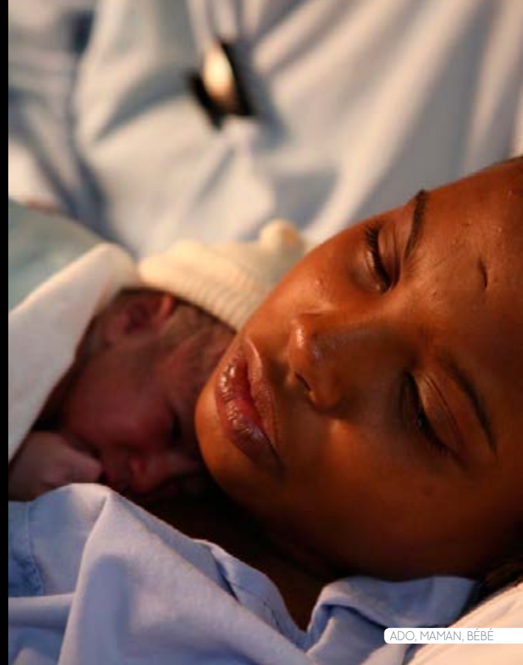
ADO, MAMAN, BÉBÉ