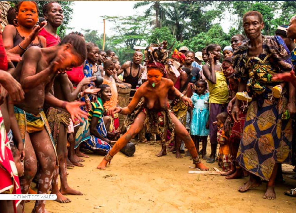
LE CHANT DES WALES