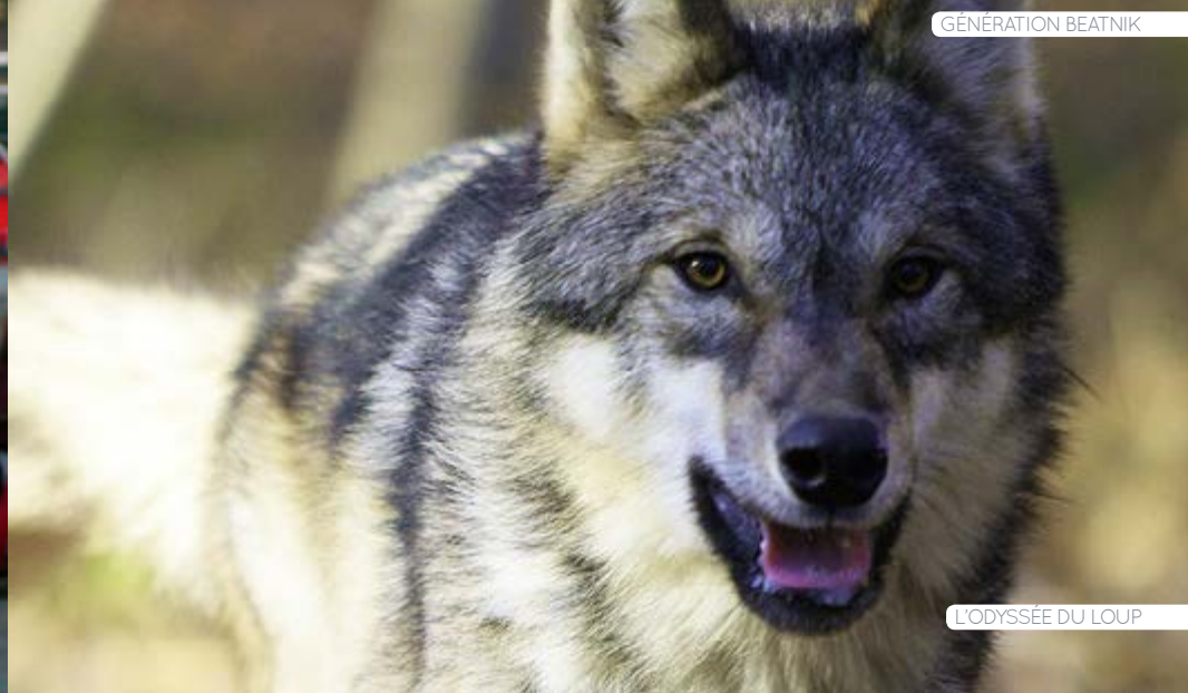
L'ODYSSÉE DU LOUP