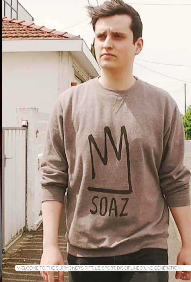
WELCOME TO THE SUMMONER'S RIFT, L'E-SPORT, DISCIPLINE D'UNE GÉNÉRATION