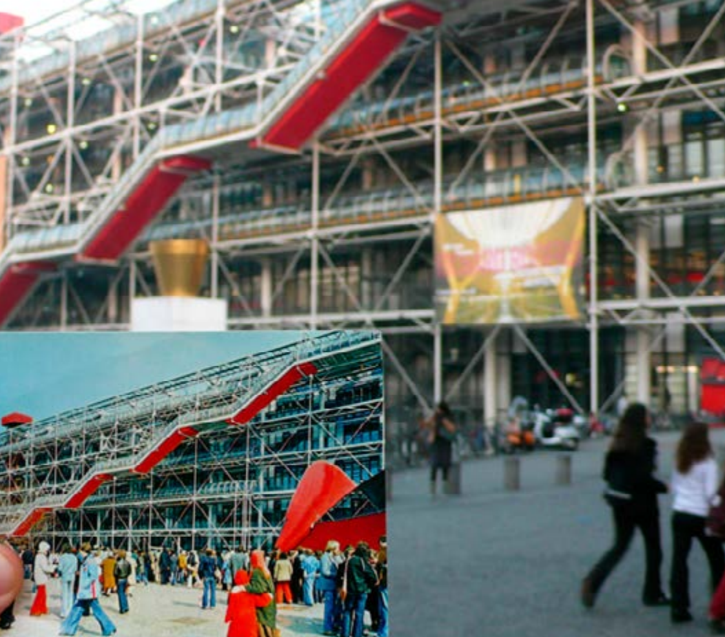
BEAUBOURG A 40 ANS