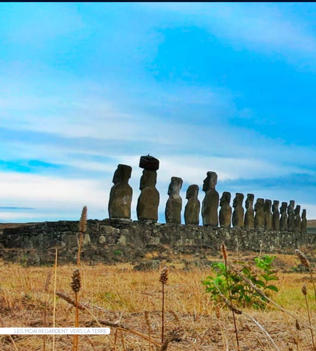
LES MOAI REGARDENT VERS LA TERRE