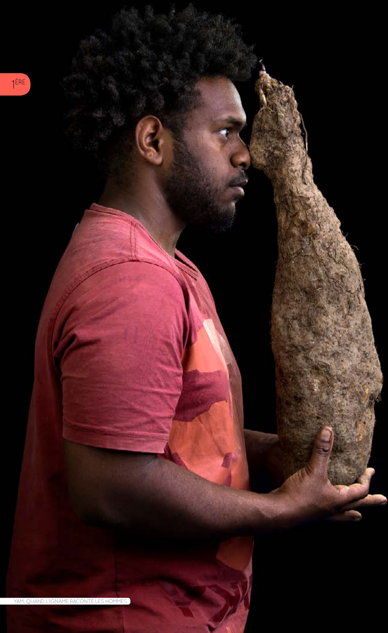
YAM, QUAND L'IGNAME RACONTE LES HOMMES