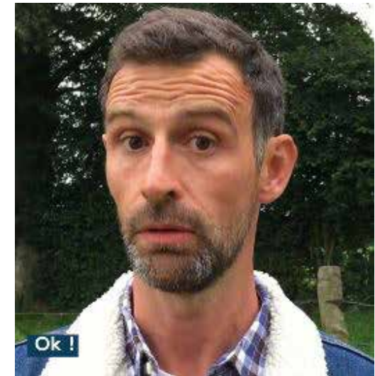
Cliquez sur l'image

Ce programme court numérique met une personnalité face à des questions rapides qui demandent une réponse courte, concise et humoristique. Les questions sont abscons et doivent répondre à un choix devant une dualité : Camembert ou Cidre ? Cheval ou Poney ? Le tournage se faisant au fil de l'eau en fonction de personnalités invitées sur nos plateaux.