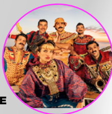
LUNDI 22 NOVEMBRE DELUXE France - Electro Pop

Décembre 2021 s'annonce riche en concerts ! Après plusieurs mois sans show en raison de la crise sanitaire, le Sakifo compte bien se rattraper en nous programmant plus de 40 concerts pour accueillir de nombreux artistes locaux, nationaux et internationaux.