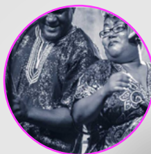
MARDI 23 NOVEMBRE VOTIA Maloya - La Réunion

Retrouvez Deluxe sur la scène du SALALHIN le vendredi 10 décembre à 21H00.