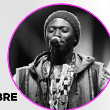
MERCREDI 24 NOVEMBRE CHEIKH IBRA FAM Afro Pop - Sénégal

Retrouvez Votia sur la scène FILAOS du SAKIFO le Vendredi 10 décembre