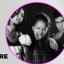
JEUDI 25 NOVEMBRE LOHARANO Rock / Métal - Madagascar